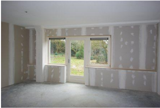
De bouw vordert