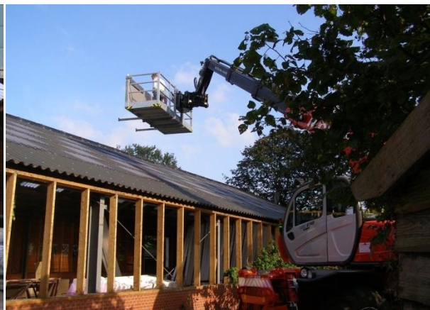
Bouw van de appartementen

De periode oktober 2010 – mei 2011 is vooral besteed aan het realiseren van de kleinschalige woonvoorziening voor acht bewoners met een Autisme Syndroom Stoornis (ASS). De (grote) schuur van aangekochte boerderij/kwekerij is voor dit doel omgetoverd van één grote ruimte in zes woonunits, met een grote gemeenschappelijke woonkeuken.