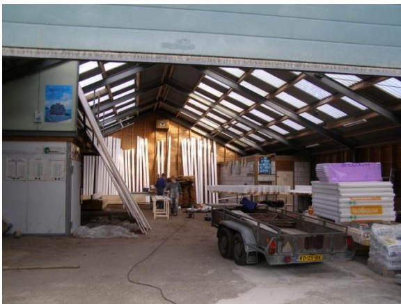
Verbouw van stal tot woonvoorziening