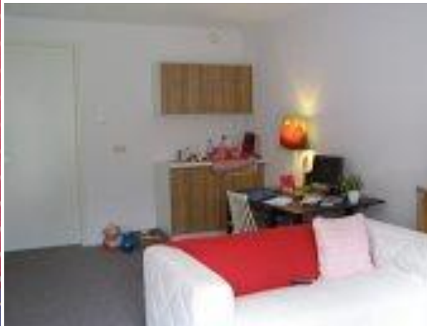
Elke unit heeft een eigen uitstraling.

Behalve de zes woonunits in de voormalige schuur zijn er ook nog twee extra ruimtes in het bedrijfsdeel van het woonhuis van Anke en Eric gemaakt voor bewoners die meer zorg nodig hebben en/of te jong zijn om in de appartementen te wonen.