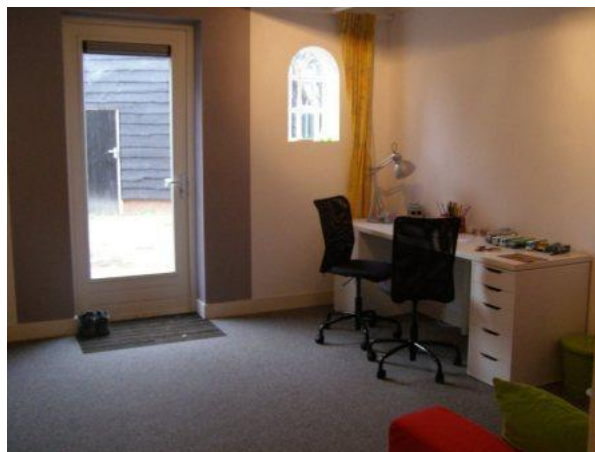
Unit voor intensieve zorg/jonge bewoners

Behalve de zes woonunits in de voormalige schuur zijn er ook nog twee extra ruimtes in het bedrijfsdeel van het woonhuis van Anke en Eric gemaakt voor bewoners die meer zorg nodig hebben en/of te jong zijn om in de appartementen te wonen.