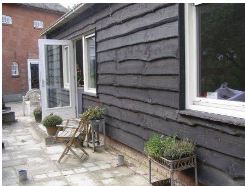
Het terras aan de tuinzijde

Elke woonunit heeft een aparte toegangsdeur tot de grote lommerrijke tuin. Vier appartementen komen uit op het terras aan de kant van de huidige tuin (waar de moestuin en de publiekstuin later komen); twee units en de gemeenschappelijke ruimte komen uit op een terras gelegen naast de kinderboerderij en de kas. Aan deze kant komt zal een afscheiding komen om de privacy van de bewoners te waarborgen.